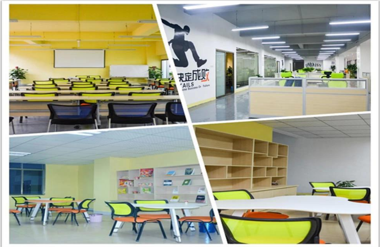
Exhibición de la fábrica: